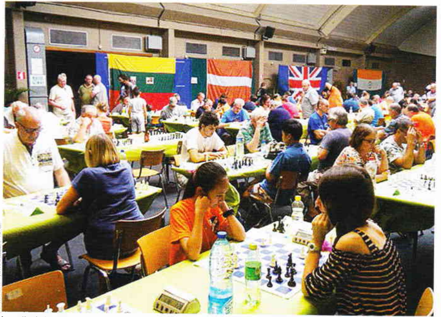
La salle de jeu du complexe de Roux.

24. ♗d4 ♜b7 25. ♗xe5 ♗xd5 26. ♗xg7+ ♗xg7 27. ♗xd5+ et les Blancs vont gagner, malgré la Dame de moins.